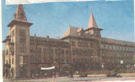
Государственная консерватория имени Л. В. Собинова